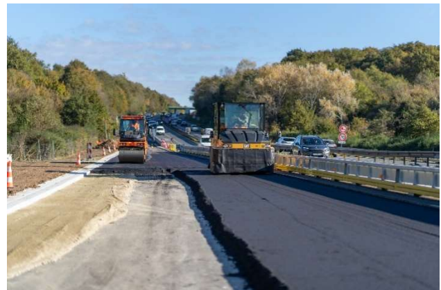
Mise en œuvre des enrobés sur la bretelle permettant de relier le périphérique est et l'autoroute A11 en direction de Paris.