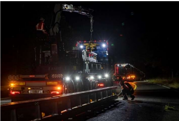
Déploiement des équipements de sécurité sur le périphérique est.

Depuis trois mois, les compagnons se relaient jour et nuit pour réaliser les travaux nécessaires à la mise en circulation de ces voies. Elles permettent d'accueillir provisoirement le trafic, pendant la construction des liaisons définitives permettant de relier le périphérique est au périphérique nord et l'A11 Paris au périphérique est, et en particulier la construction de deux ouvrages d'art.