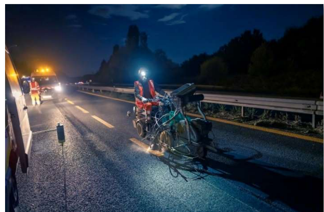
Peinture au sol sur l'autoroute A11.