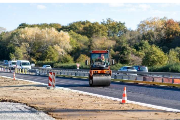
Compactage des enrobés sur la bretelle permettant de relier le périphérique est et l'autoroute A11 en direction de Paris.