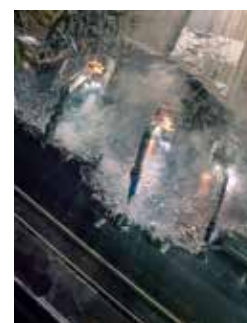
Démolition du pont de la route de La Chapelle-sur-Erdre.