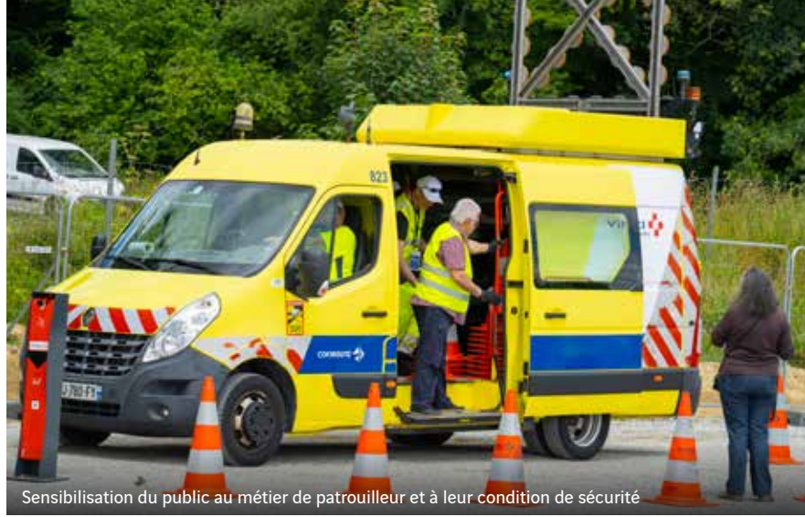
Sensibilisation du public au métier de patrouilleur et à leur condition de sécurité