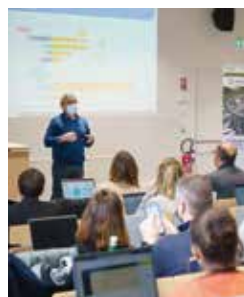
Hackathon décarbonation en partenariat avec l'École Audencia Nantes