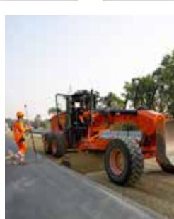
Élargissement du périphérique est dans les 2 sens.