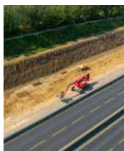
Réalisation des talus raidis sur le périphérique nord. De février à juin 2022

Les six premiers mois de 2021 ont été marqués par la mise en service de boucles et bretelles provisoires et définitives, mais aussi par le démarrage des travaux au niveau des viaducs est et ouest. Entre technicité et coordination, le premier semestre de l'année 2022 a, lui aussi, été riche en nouveaux aménagements structurants dans le cadre du projet. Le tout ponctué par une volonté forte de la part de VINCI Autoroutes et des entreprises de travaux de faire découvrir le chantier au plus grand nombre.