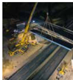
Mise en place du pont provisoire au niveau de la route de La Chapelle-sur-Erdre.