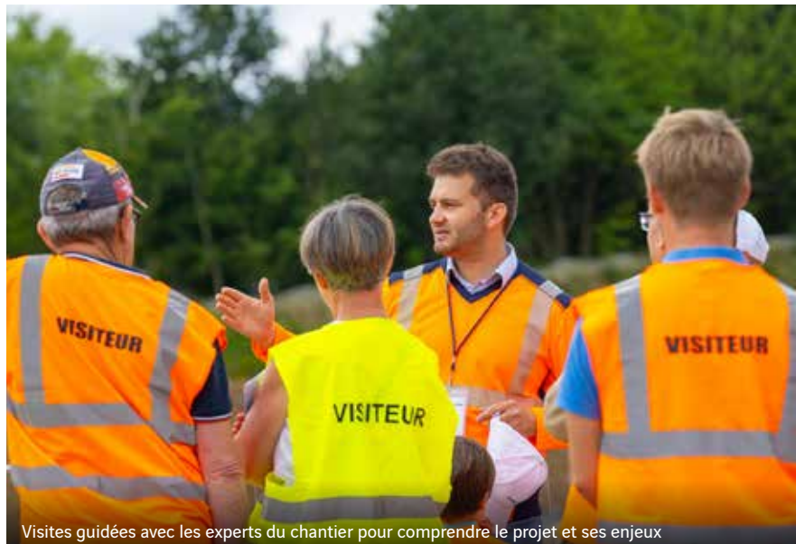
Visites guidées avec les experts du chantier pour comprendre le projet et ses enjeux

L'opération d'aménagement de la Porte de Gesvres est un chantier majeur pour les nantaises et les nantais. Et pourtant, c'est un univers encore trop mal connu du grand public, riverains ou non du chantier.