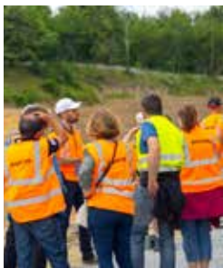
Journée portes ouvertes sur le chantier avec accueil du grand public