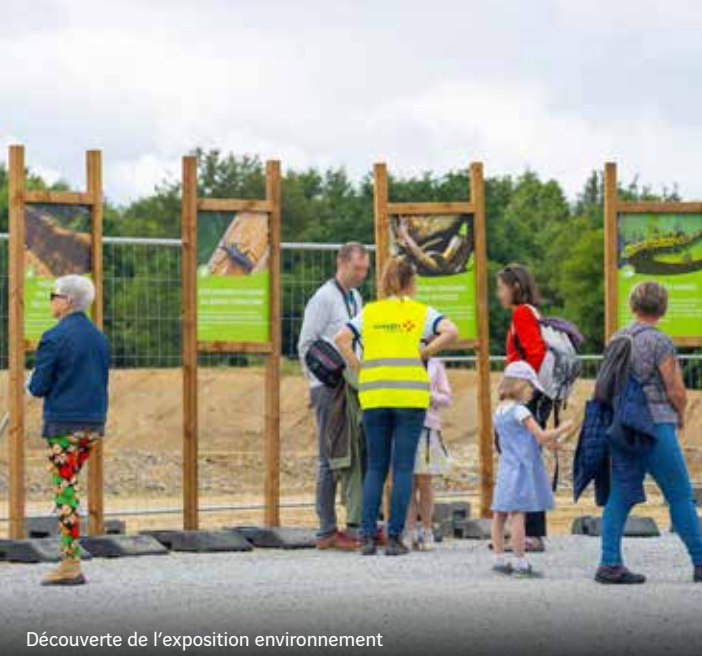
Découverte de l'exposition environnement