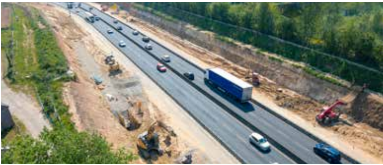
Travaux de terrassement sur le périphérique nord dans les deux sens

Enfin, les usagers sont aussi acteurs de leur sécurité, et de celle des professionnels intervenant sur l'autoroute, en adaptant leur vitesse quand ils arrivent dans ces zones. »