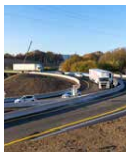
Mise en circulation de la bretelle assurant la liaison entre le périphérique nord et le périphérique est.