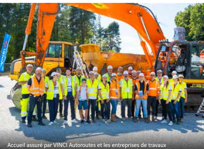
Accueil assuré par VINCI Autoroutes et les entreprises de travaux